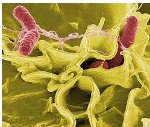
Figura 05. Salmonella sp.