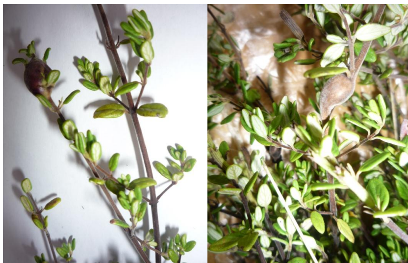
Figura 01. Talluelos de runtuwayra.