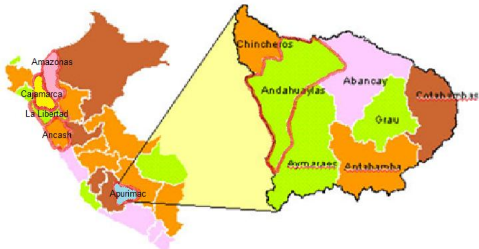
Figura 03. Mapa de distribución de Clinopodium weberbaueri - runtuwayra.

La Clinopodium weberbaueri , se desarrolla en Bosque tropical Estacionalmente Seco (BTES) de valles interandinos, matorral seco, de piedra arenisca, seco, a modo de pendientes pronunciadas de roca caliza; entre altitudes de 1500 – 3600 m como: Amazonas, Ancash, Cajamarca, La Libertad y Apurímac en la provincia de Andahuaylas ; constituyendo el primer registro nuevo para la flora sur peruana (Figura 03).