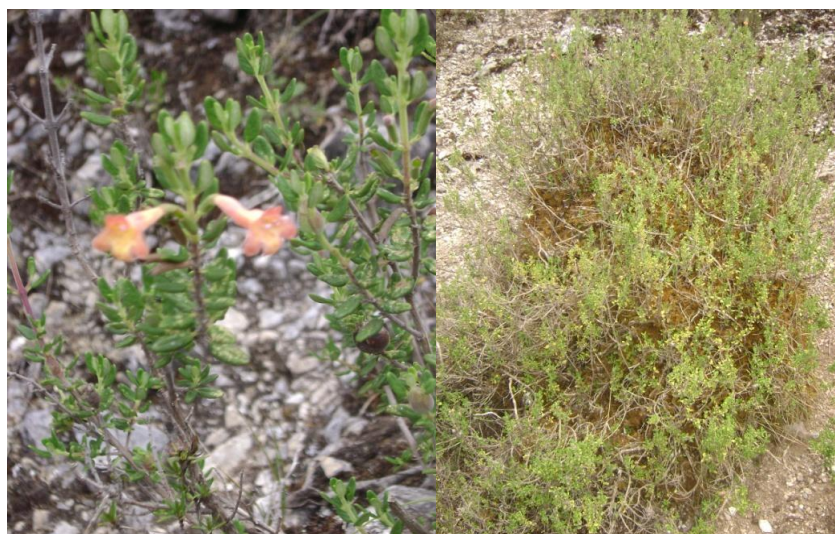
Figura 02. Detalles de la flor y planta de runtuwayra.