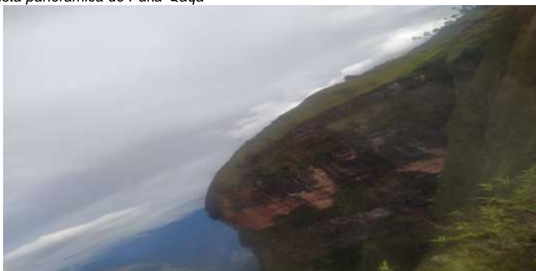
Vista panorámica de Puka-Qaqa

Nota. La fotografía muestra la vista panorámica de Puka-qaqa, el lugar donde había la señal.